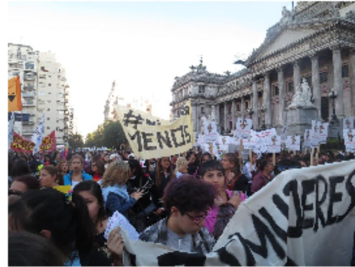
Ni una menos