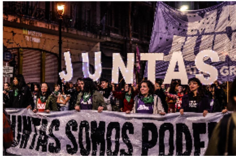
6 años desde la 1era marcha